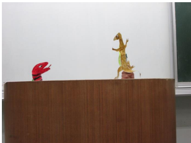
不吵不相識偶戲演出