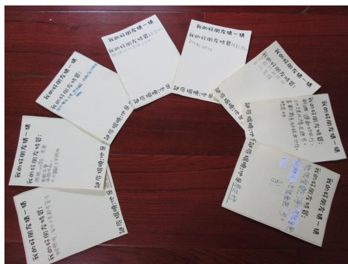
欣賞好朋友的優點