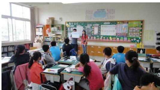
小組報告討論結果之一