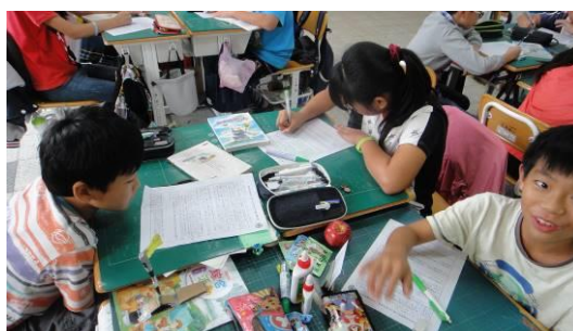
學生合作完成學習單