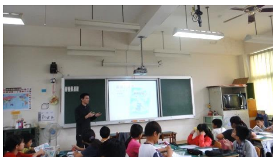
教師提問，引導學生思考