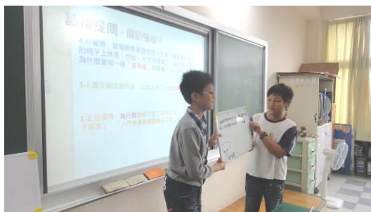
小組報告討論結果之二