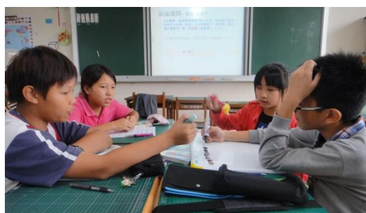
學生討論問題寫下想法，發表意見