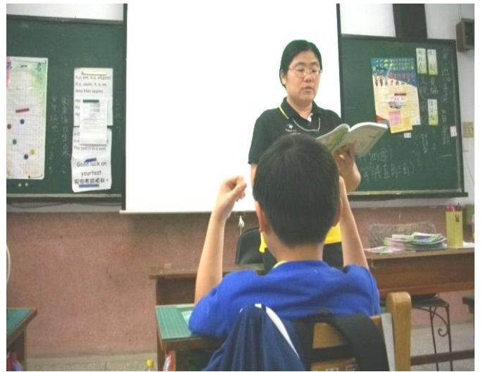
不吵不相識封面預測，講述不吵不相識找出重點的方法後，老師再總述一遍