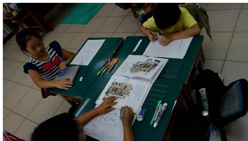
畫下書中最喜歡的畫面