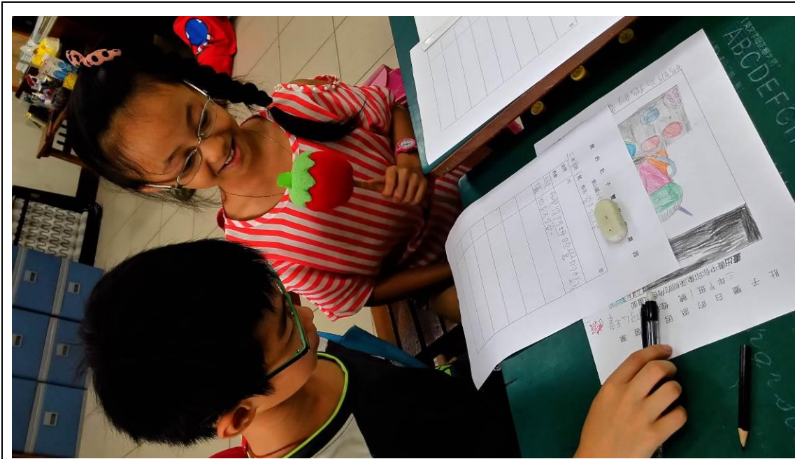
擔任小記者，訪問同學對於書中印象深刻的事並將訪談內容作紀錄