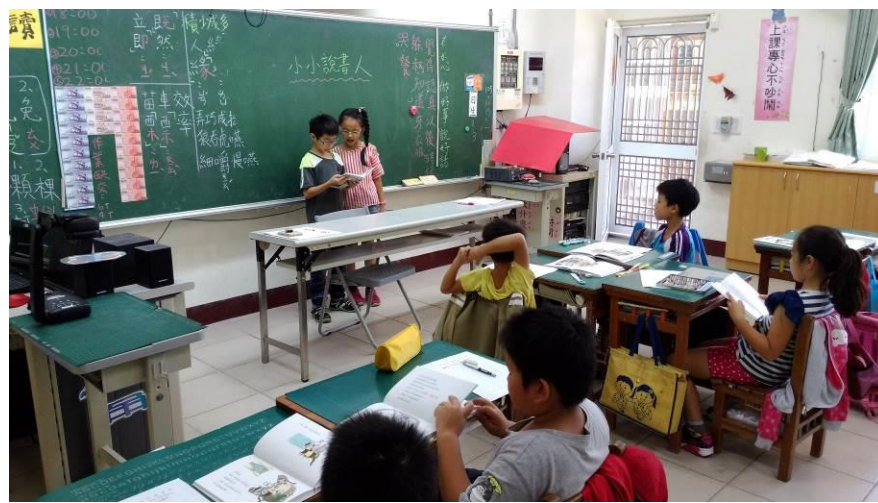
小小說書人-請同學輪流上台分享喜歡的段落