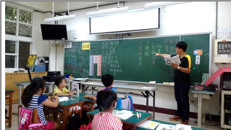
老師簡單介紹書籍的結構