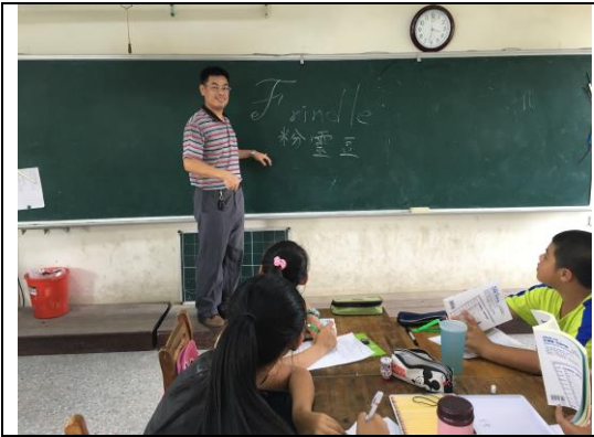
故事導讀--猜猜到底是什麼豆