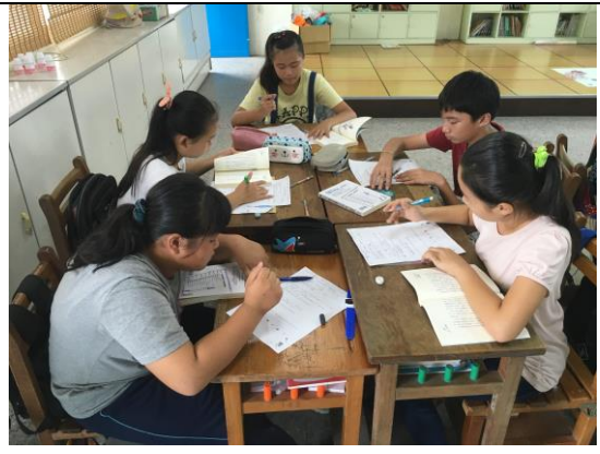
設計學習單讓學生討論思考