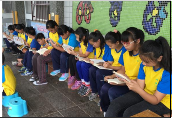
閱讀趣味無窮，享受美好時光