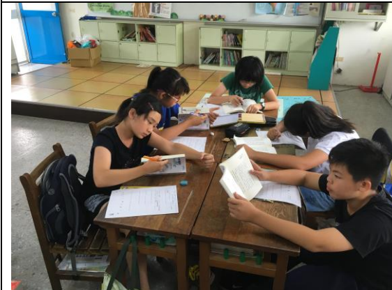
設計學習單讓學生討論思考