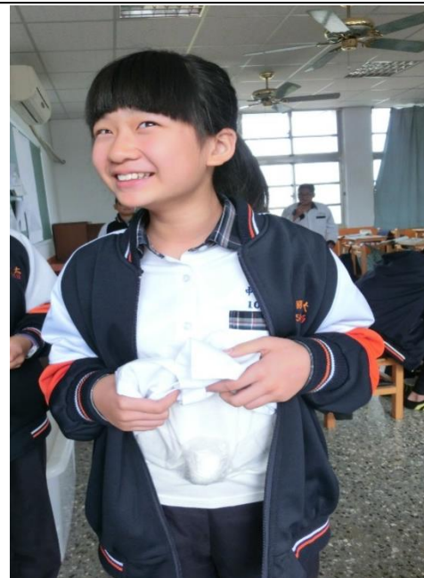
肚子裡有「三個月的寶寶」