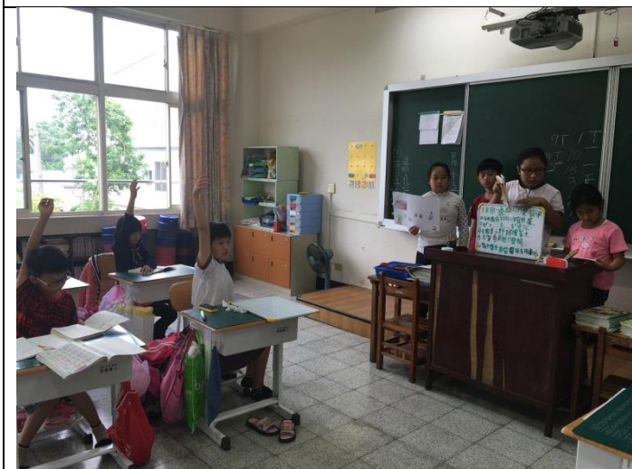
小組報告 - 3