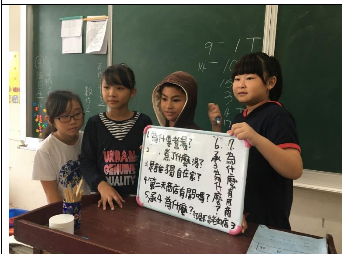
小組報告 - 1 問句呈現