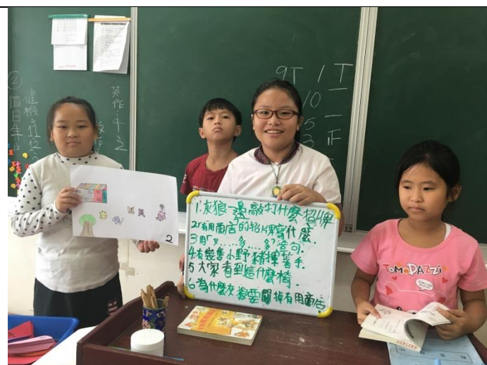
小組報告 - 2 這組除了圖示，還找出了造句要考大家