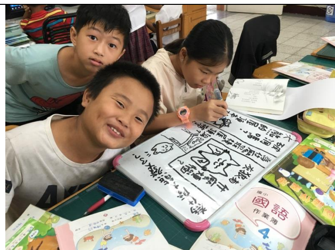
小組討論 - 2 看圖說故事