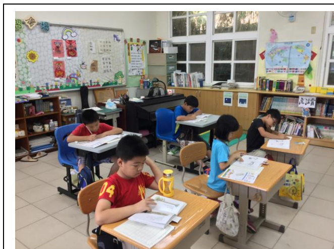
說明：預測故事內容