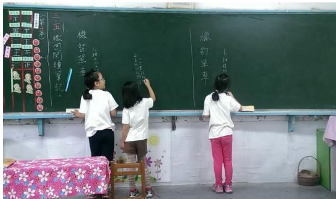
上台寫下討論結果並報告