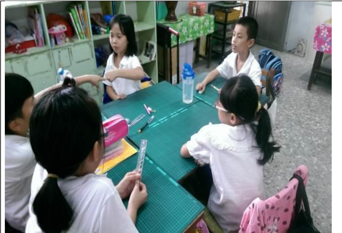
分組討論：遇到怪叔叔怎麼辦？