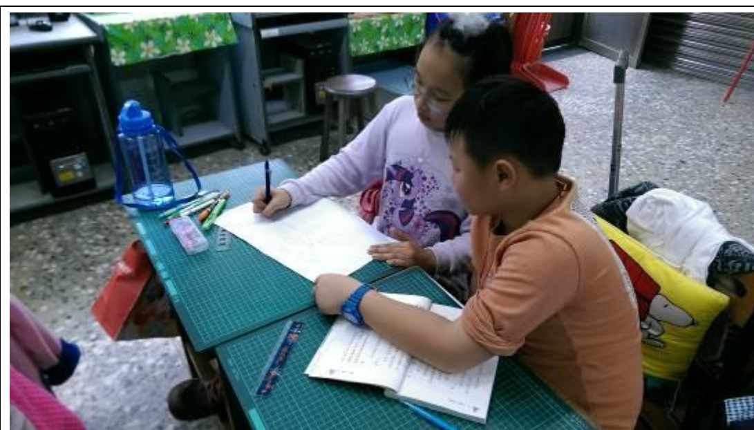
集思廣益設計單車