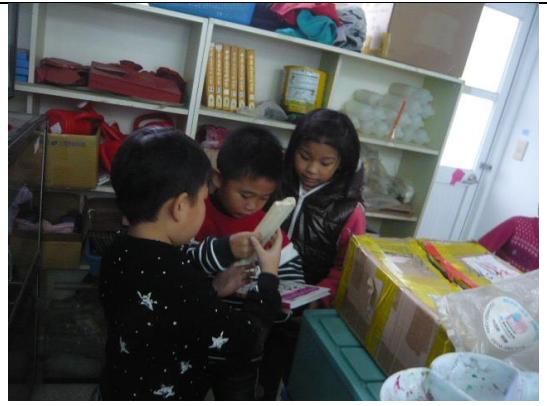
說明：再仔細比對找一找 大家好新奇