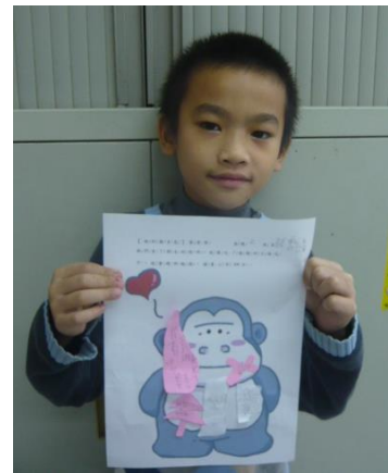
說明：我收到的麻吉包 感動喔