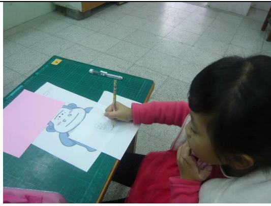
說明：大家專心做麻吉包 謝謝好友