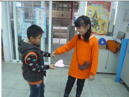
說明：我想跟你做朋友 好嗎？