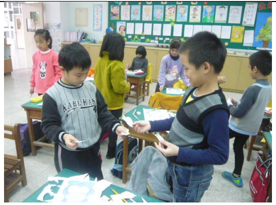
說明：與好友交換麻吉包並擁抱說謝謝