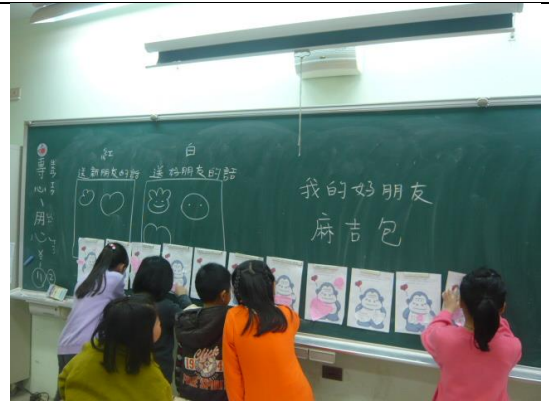
說明：大家相互欣賞與鼓勵