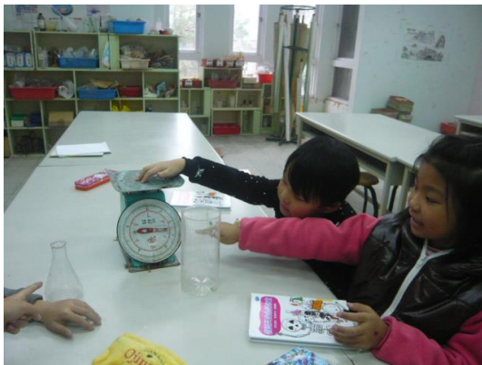
說明：各組發表自己的發現與心得