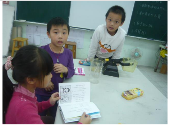
說明：實驗器材在書中的對話與功能