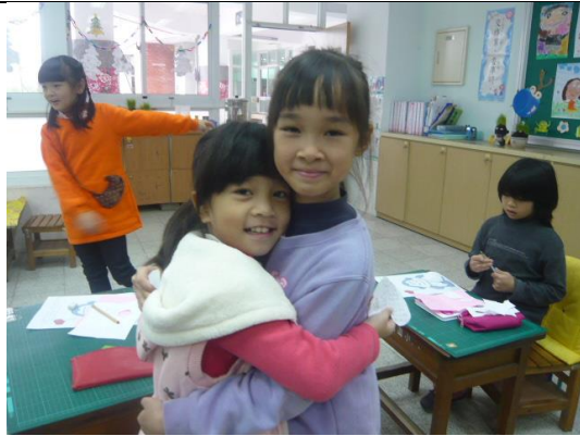
說明：謝謝你當我的好朋友