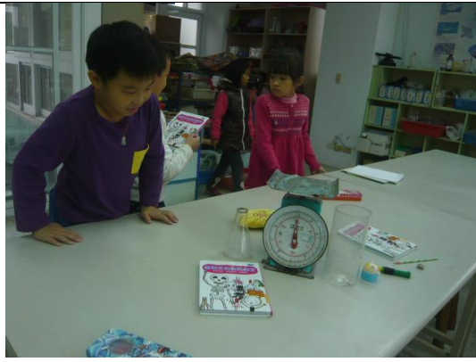
說明：大家比對書中角色及功能