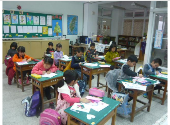
說明：麻吉包製作中 好認真喔！