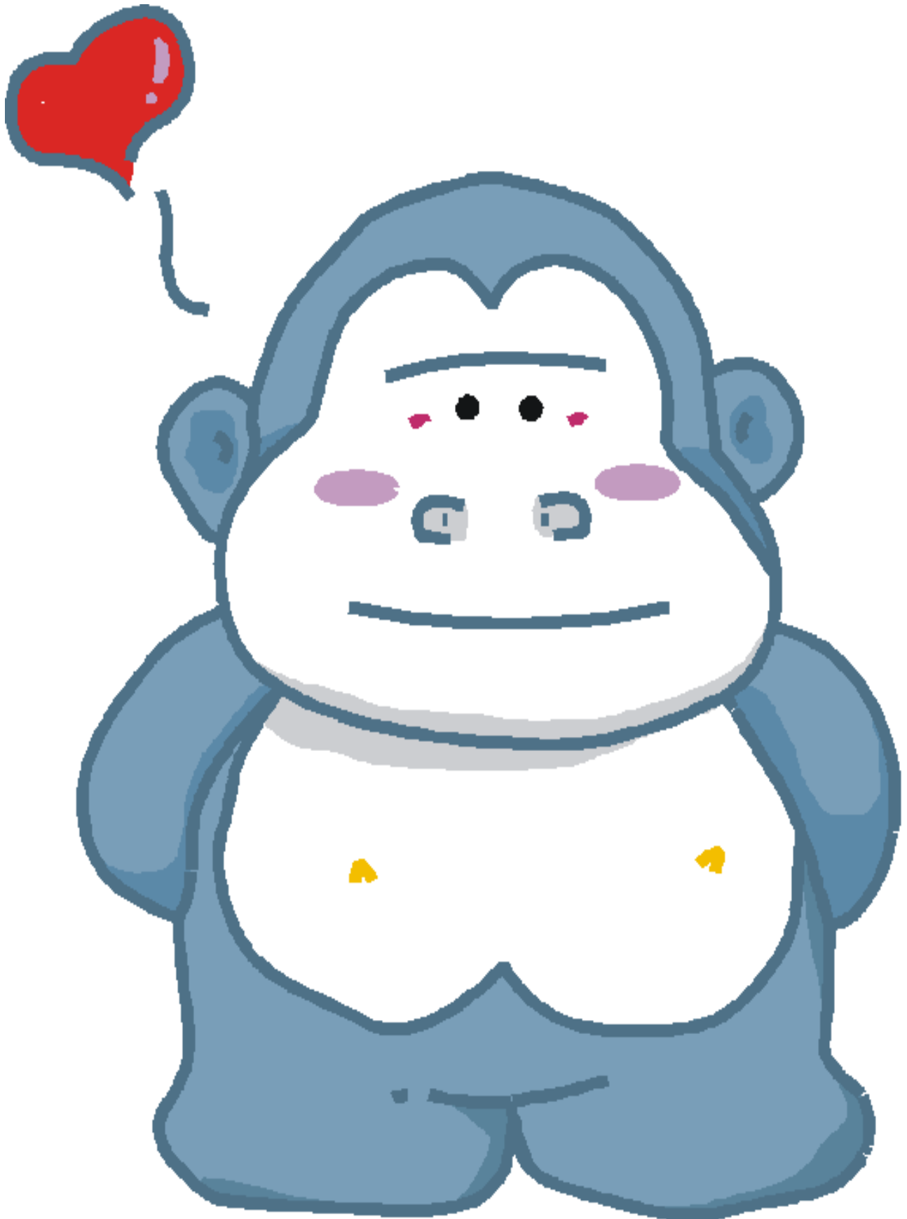
可愛的超級包及新鮮包 學生創作

* 我們有了朋友的陪伴，就像吃了飽飽的元氣包子，就會精神飽滿，讀書工作 100 分。( 趕快去找你的好朋友交換你的麻吉包子吧！ )