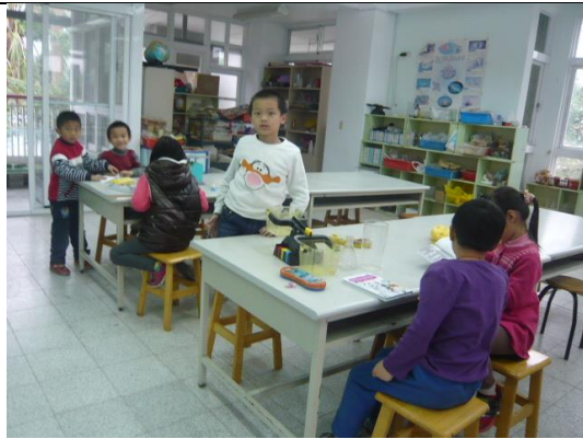
說明：大家喜歡自然教室 好好玩