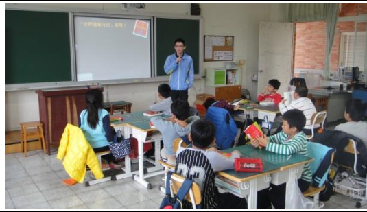
教師提問，引導學生思考