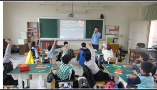
學生踴躍發表意見