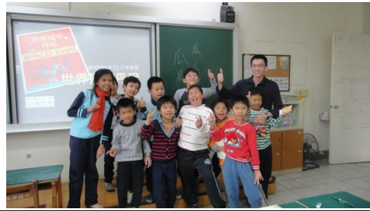
快樂的完成結束課程