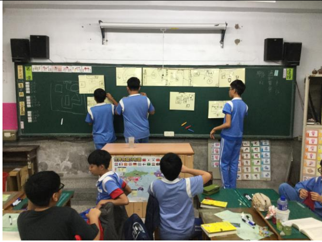
【冒險地圖】主題活動，成果展示及發表。