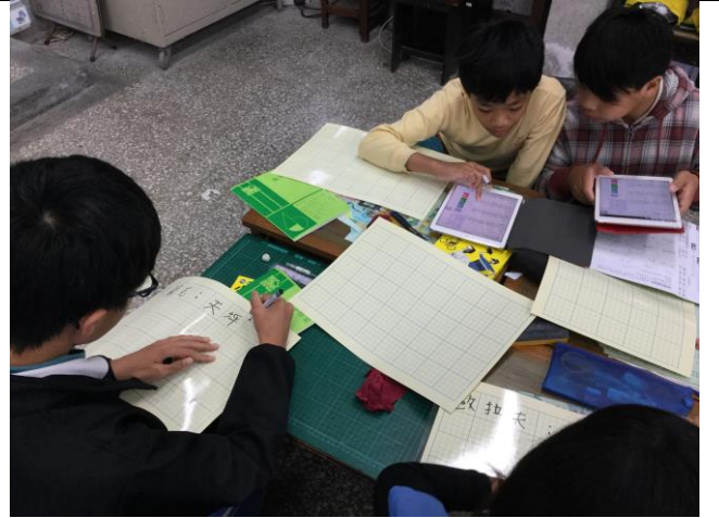
使用 IPAD 進行「星座少年」主題活動。