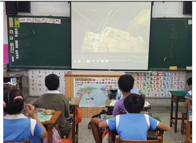
分析「文本與電影」給讀者的不同感受。