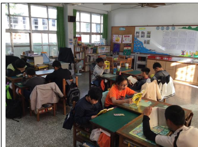
學生利用晨光時間閱讀。