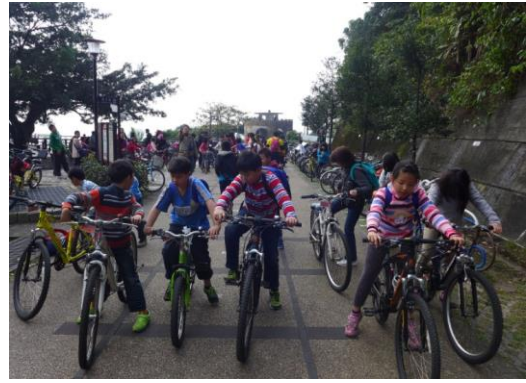
中、高年級遠征福隆-石城。