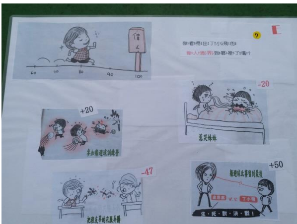
丁小飛飛之藍鵲尋寶題目 6