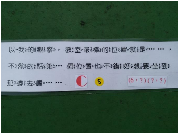
丁小飛飛之藍鵲尋寶題目 3