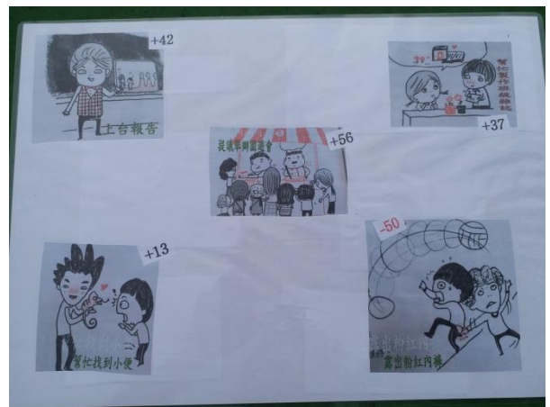
丁小飛飛之藍鵲尋寶題目 6