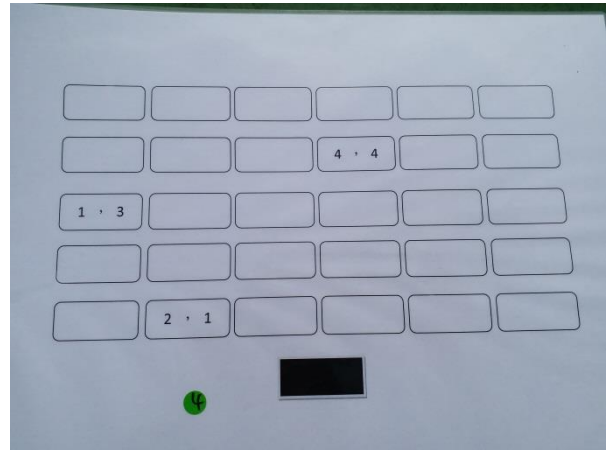
丁小飛飛之藍鵲尋寶題目 3