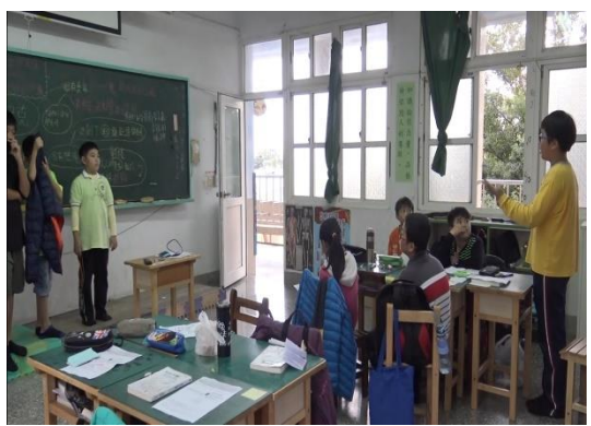
組與組腦力激盪如何協助他人轉念