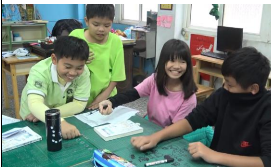
學生討論且規劃「不可能的任務」