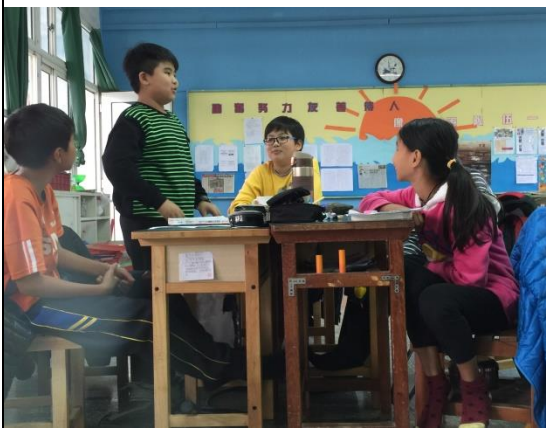
學生於組內分享個人轉念的事件