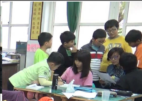
教師回饋學生擬定的「不可能的任務」