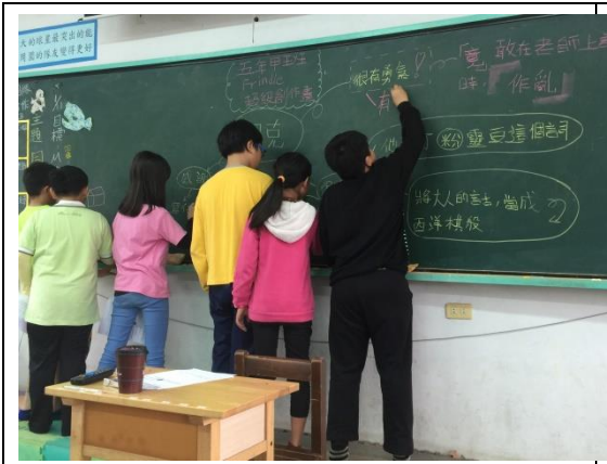
全班一同製作 尼克特質 的心智圖