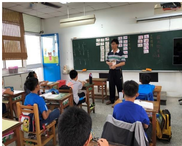
教師與學生進行章節詳讀，並且以情緒卡討論書中人物的情緒變化，理解章節中情節的鋪陳