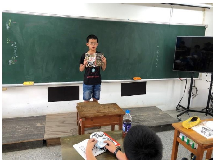
學生閱讀之後，進行心得分享，同時教師檢視學生閱讀的熟練程度。