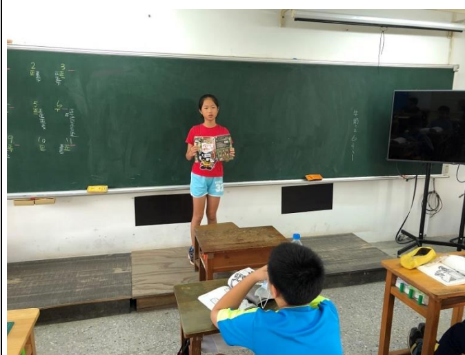
學生進行故事接龍，將一個章節的故事完整拼湊起來，可以幫助學生加深故事的印象，並且幫助閱讀能力較弱學生理解故事。