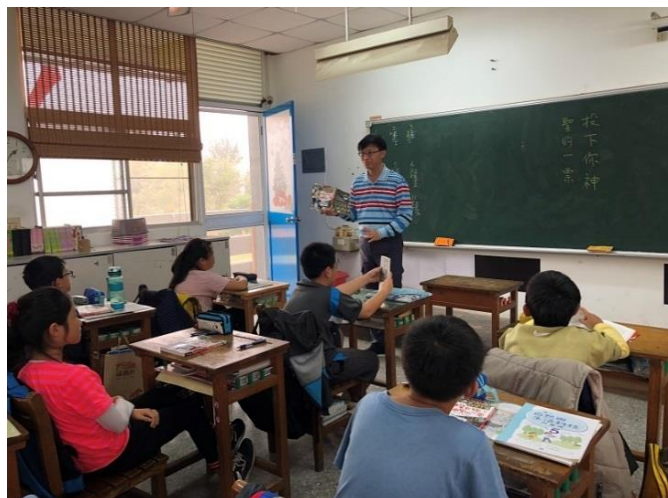
教師介紹本書，並且與學生進行章節預測。