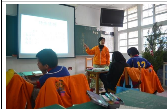
從目錄選出個人喜歡的篇名