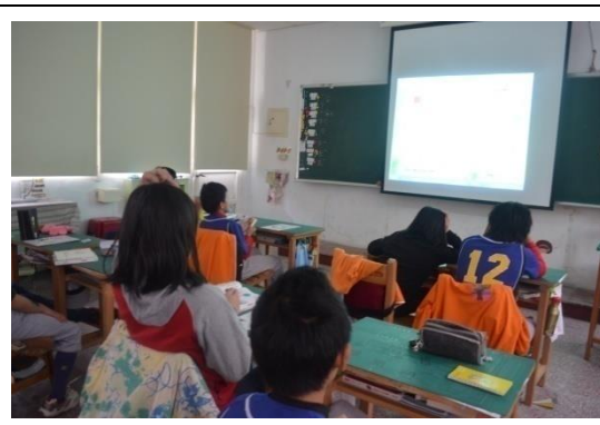
他校學生製作的電子書參考