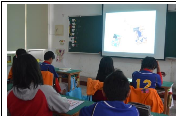
《不要講話》有三種不同的封面