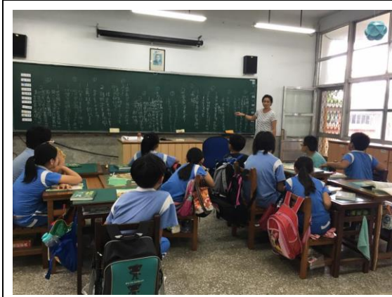
師生共同討論同學的提問