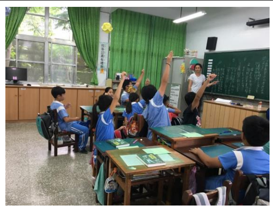
同學踴躍搶答同學的提問