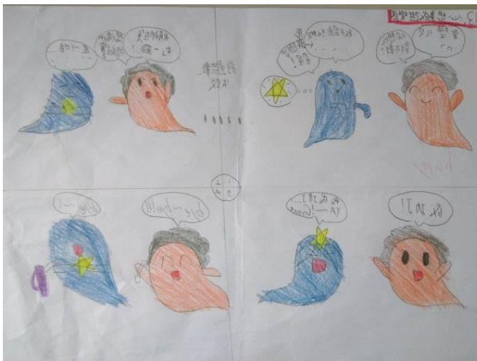
《鬼來了！咚咚咚篇》生動突出的筆觸