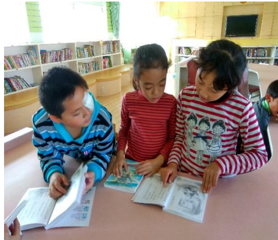
針對文本內容進行討論