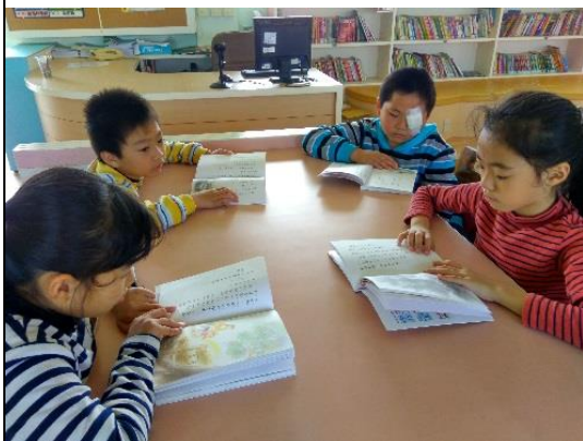
利用閱讀十分鐘時間閱讀