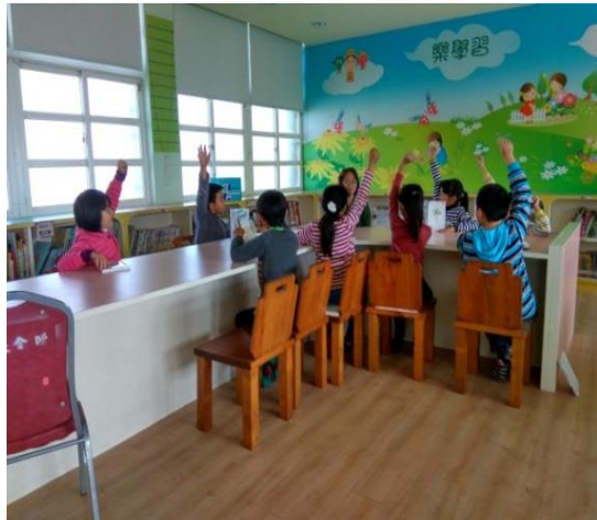
小朋友踴躍舉手發言