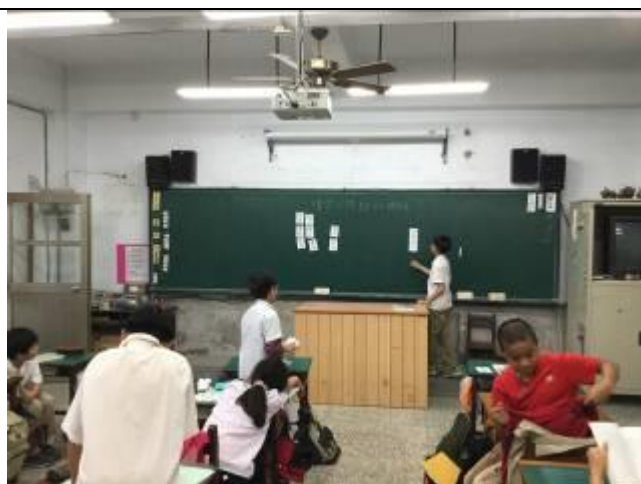
學生將討論出來的性格卡，貼在黑板上。