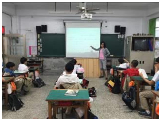
師生共同討論故事情節。