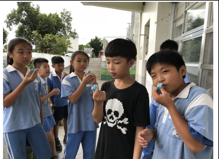
可以再更好~改良中