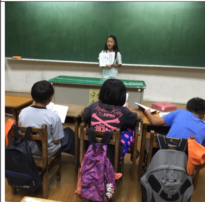
3. 個人分享最喜歡的部分