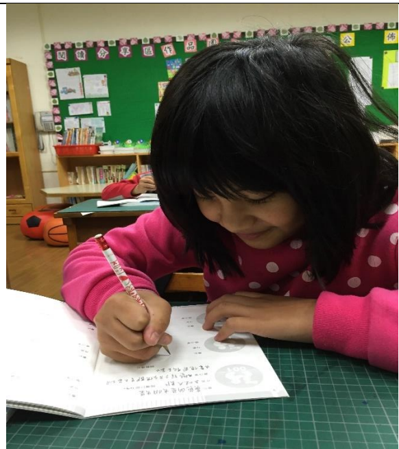
4. 把心得寫在閱讀護照