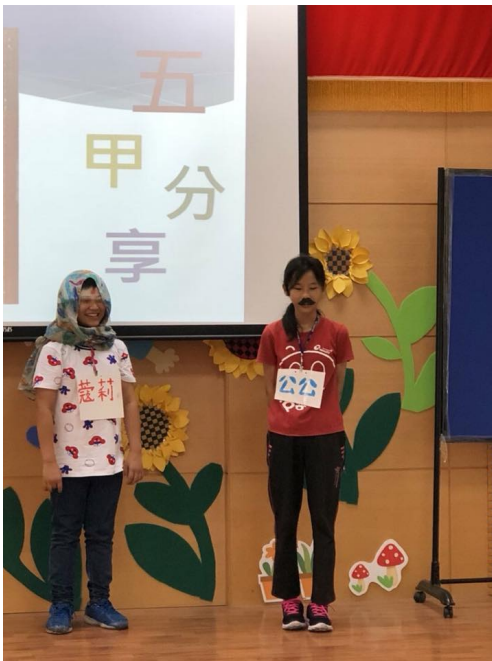
彩排請假的『公公』表現超好！

正式上台表演，同學們都不怯場，連一年級的小朋友都台風穩健，非常成功，期許下次同學們有更棒的想法，能夠用不同的方式推薦更多的書籍給其他小朋友。