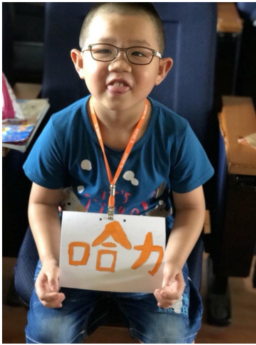
謝謝一年級同學的配合演出