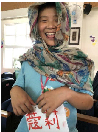
感謝班上唯一男同學反串演出