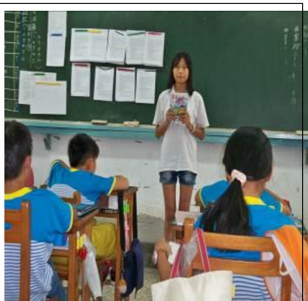
國語第六課剛好上到單車日記↓