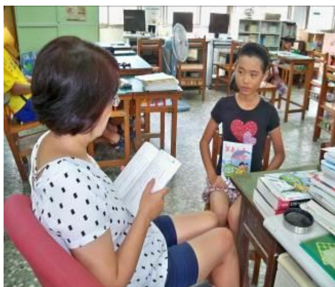
單車達人到校分享↓