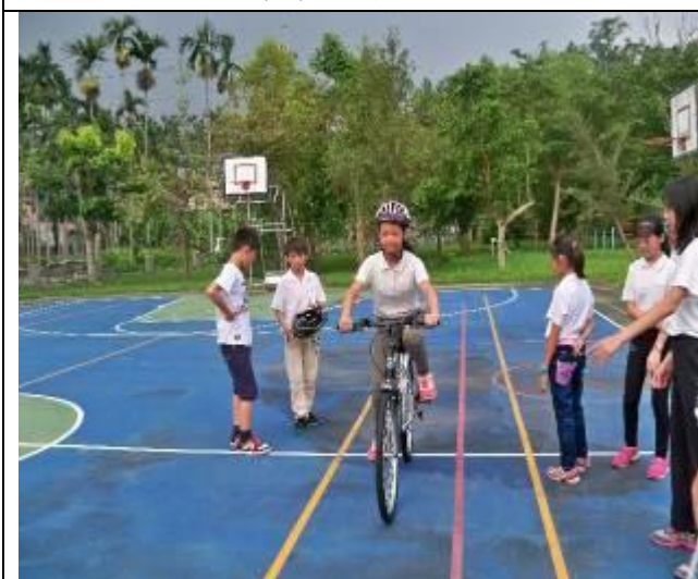
大家都通過路考拿到老師自製的駕照了↓