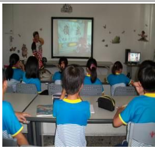
開心與單車達人合影↓