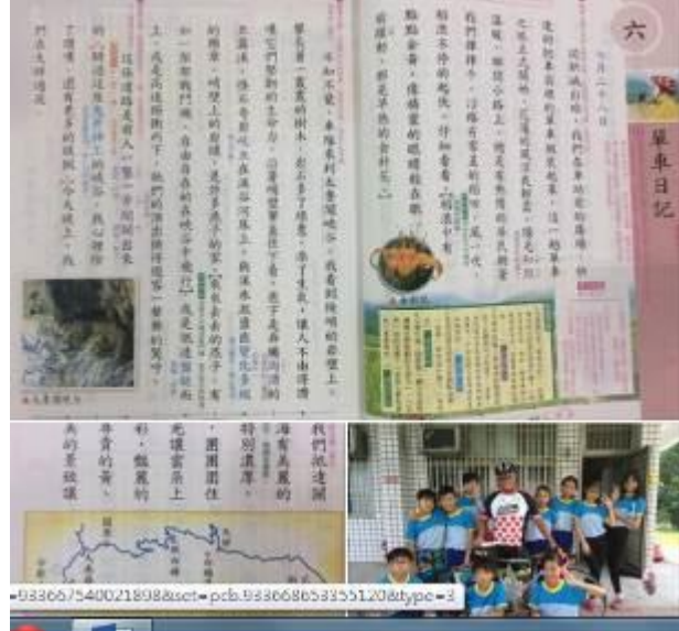
叔叔終於騎到武嶺了↓