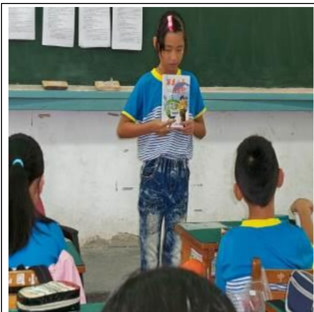
下課時間找老師分享所讀內容↓