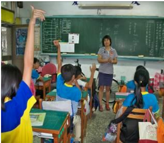
討論完注意事項後，接著是筆試活動↓