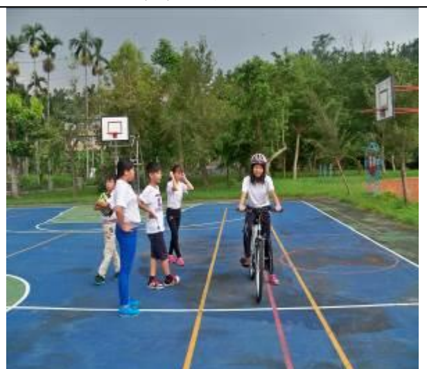
展示好不容易拿到的駕照↓