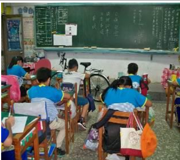
老師先說明考試規則↓