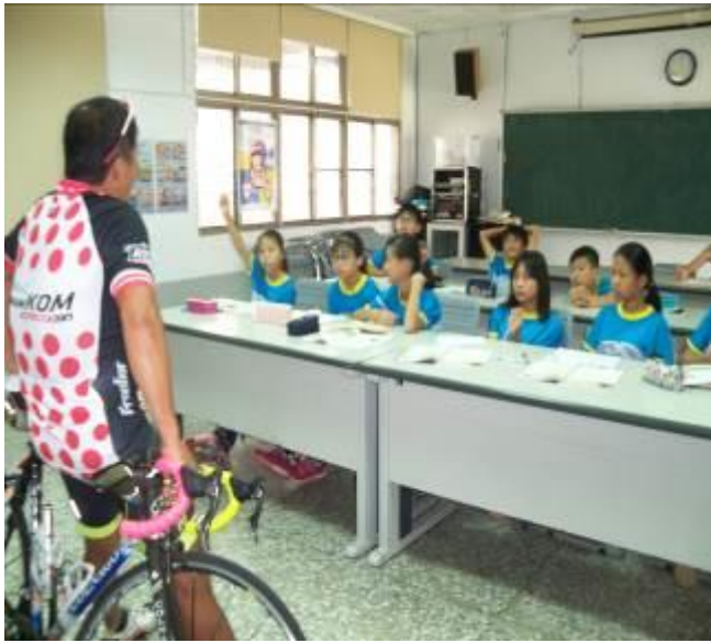
大家熱烈討論騎腳踏車須注意的地方↓