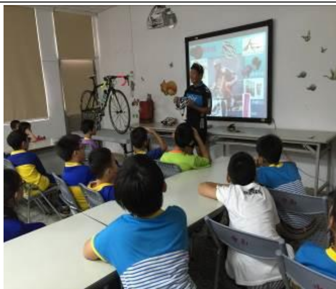
現場提問不斷，大家都對達人經歷頗感興趣↓