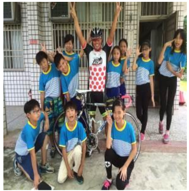
即使是騎腳踏車，也要戴上安全帽↓