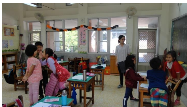
師生共讀書目中精采的故事情節