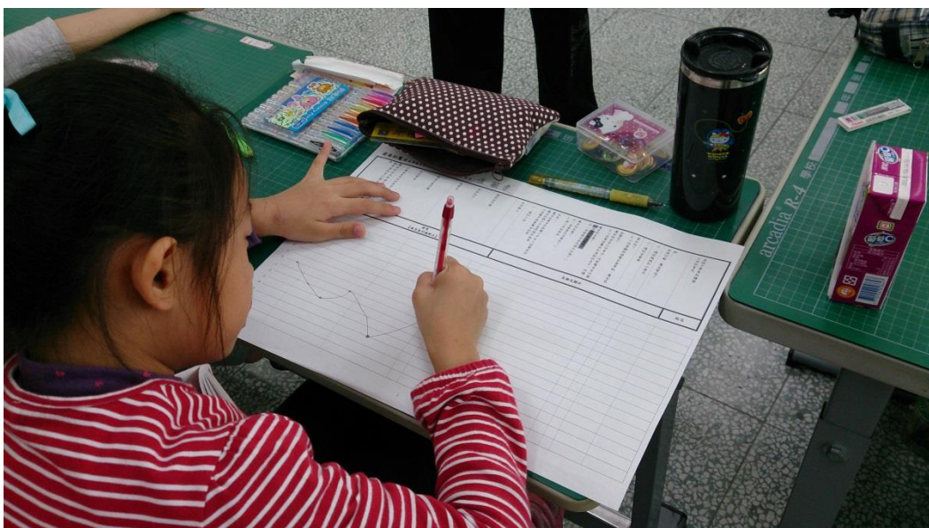
↑ 試著畫畫看這本書的故事線